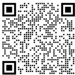
专项赛 报名二维码

3. 大赛组委会将委托技术支持单位开设竞赛平台训练账号，各参赛学校可登录大赛报名系统提交相关材料申请训练账号，大赛平台训练账号不收取任何费用。技术支持单位通过QQ群、电话等方式为参赛团队解答学习训练中的有关问题，并指导开展日常学习训练。